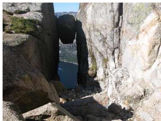
KJERAK_velký balvan mezi skalami