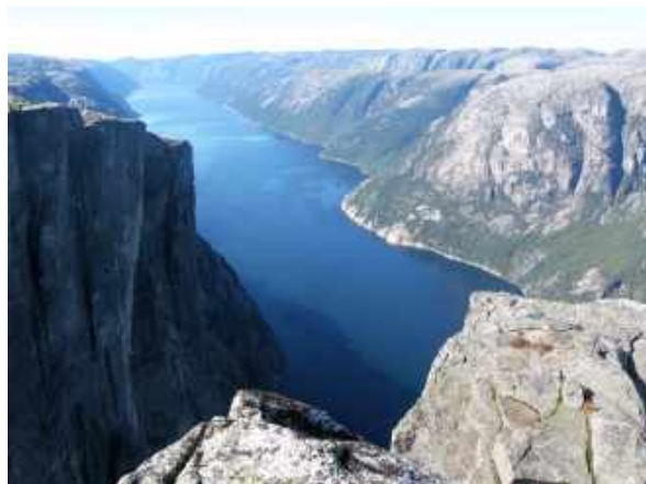
Jeden z fjordů

Byli jsme stále mokří a jednu jsme měli na stanech dokonce ledovou pokrývkou. Druhý týden už bylo počasí lepší. Projeli jsme velký kus Norska a každý den jsme spali jinde. Dělali jsme pěšky náročné túry, nejvíce v horách.