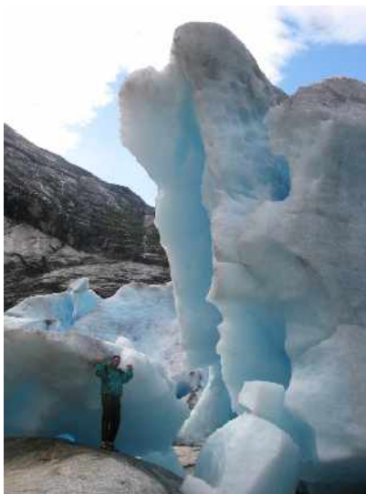
Největší ledovec v Evropě_JOSTEDALSREEN

Také jsme navštívili dva velké ledovce. Největší evropský ledovec se jmenuje Jostedalbreen. Cestou k nim jsme museli šplhat po lanech, žebřících a řetězech. Z ledovce vytéká řeka s úplně ledovou vodou. V Norsku je mnoho tunelů, které jsme autem projížděli. Jeden byl dlouhý přes 7 kilometrů. Vedou i spirálovitě do kopce a z kopce. Je tam omezená rychlost 70 km/h a někde se nesmí předjíždět. Viděli jsme i mnoho krásných vodopádů.