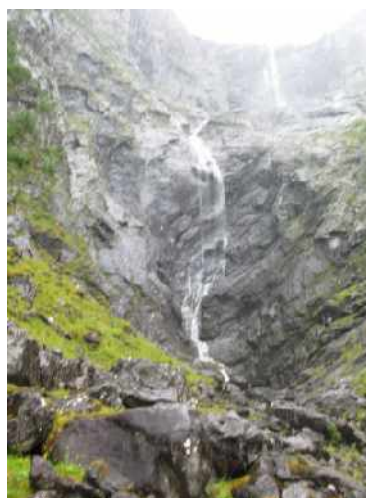
Nejdelší vodopád v Evropě MARDALSFOSSEN

A opět Zdeněk šplhající po laně k ledovci.