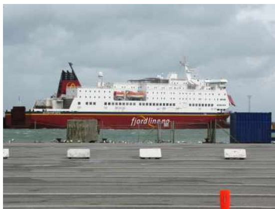
Přístav Hirtshals _trajekt

Koncem srpna jsme se vypravili, já se svým bratrem a moje maminka se svým bratrem, na dva týdny do Norska. Jeli jsme autem přes Německo do Dánska a potom nás převezl trajekt přes moře. Spali jsme ve stanech a sami jsme si vařili. První týden nám pořad přšelo.