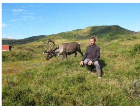
Můj bratr se sobem